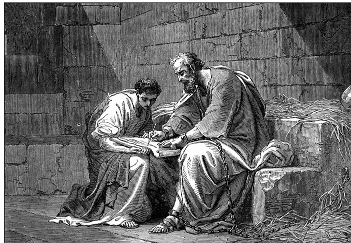
Гюстав Доре. Апостол Павел в темнице.

Тут же Апостол добавляет, что в предупреждение превозношения чрезвычайностью получаемых им откровений «дано мне жало в плоть, ангел сатаны, удручать меня, чтобы я не превозносился». «Обыкновенно думалось, — говорит еп. Феофан Затворник, — что жало в плоть, ангел сатаны — есть нечто смущавшее и беспокоившее святого Павла со стороны плоти и находившееся в самой плоти. <...> Наши толковники полагают, что святой Павел говорит здесь, так же, как и прежде, о внешних бедствиях и о неприязненности со стороны врагов Евангелия, кои суть орудия сатаны». Святой Иоанн Златоуст говорит, что слова Апостола имеют такой смысл: «Бог не благоволил, чтобы проповедь наша распространялась беспрепятственно, желая смирить наше высокое о себе мнение; но попустил противникам нападать на нас». От этих-то наветов вражых